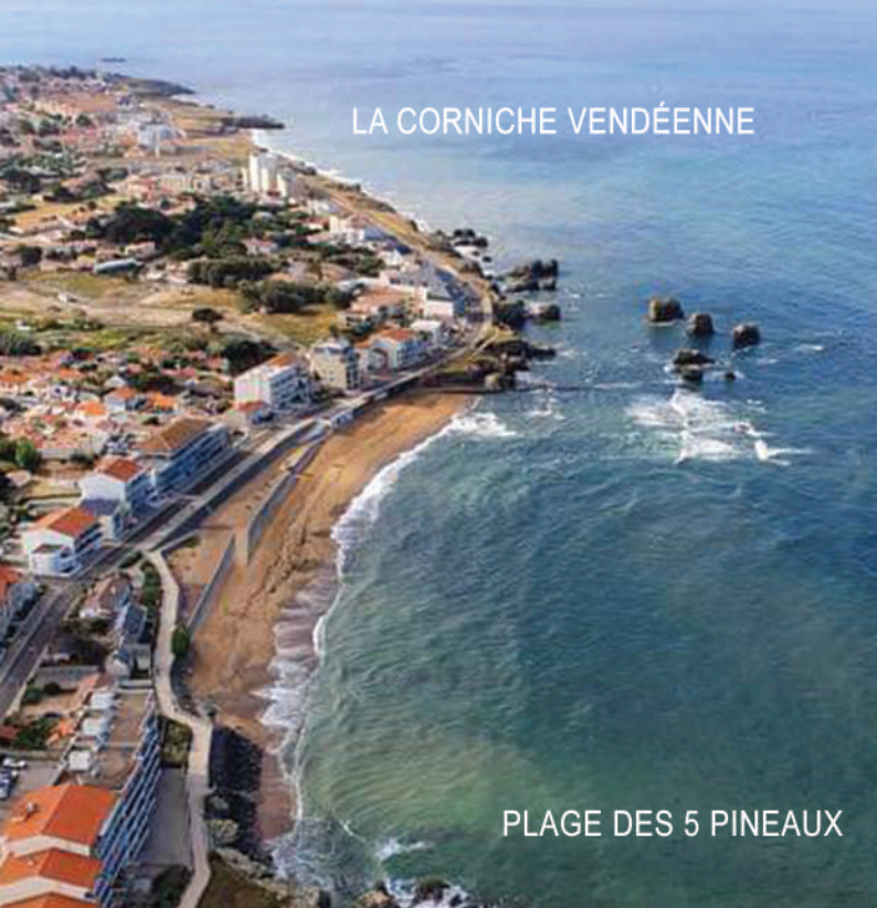
PLAGE DES 5 PINEAUX